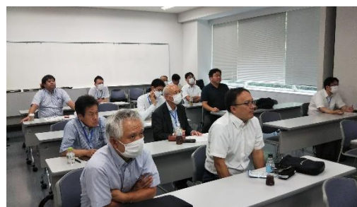
実践教育研究発表会 機械系企画（シンポジウム）の様子